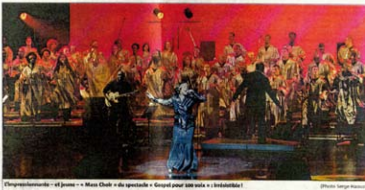
L'impressionnante « Mass Choir » du spectacle « Gospel pour 100 voix » à Jérusalem !

Impossible de résister au dynamisme, à la bonne humeur, aux talents, à la sincérité de cette « Mass Choir » (17 nationalités différentes) qui, main dans la main, chantait l'amour de la musique, l'amour des autres, l'amour de la vie. De quoi délier les plus moroses et réveiller les plus endormis dans leur petit confort. Musiciens, choristes, solistes ont fait partager leur joie et communi- quer leurs émotions,