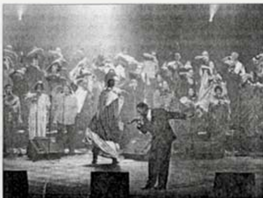
L'émotion et la foi ont envahi Acropolis grâce aux « Gospel aux cent voix ».

Alors la salle, prise par cet élan de fraternité, de swing et de foi se leva, chanta, scanda le