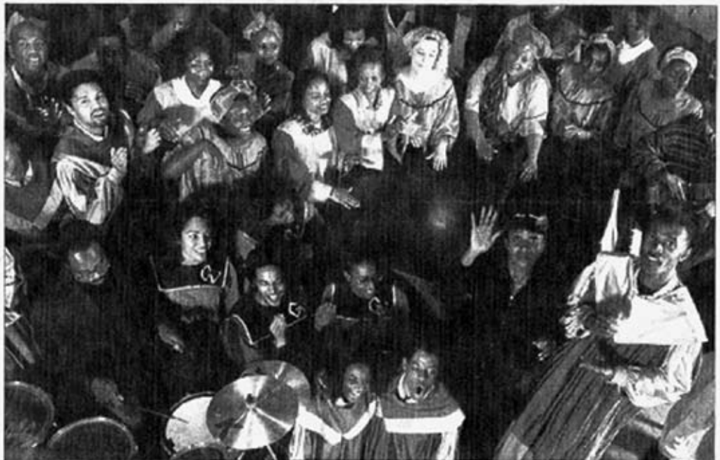
Créées pour une seule soirée, les «100 voix» tournent depuis deux ans.

Comment expliquer ce succès ? Une alchimie rare, du moins sur les scènes françaises, unit chanteurs et public, croyants (Gospel vient de «God Speak», parler à Dieu, NDLR) ou non, un esprit de